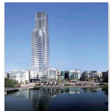
Hauptsitz der Content Management AG im Mediapark, Köln

Der Unternehmensbereich OEM-Kunden der CM-AG betreut Unternehmen der Telekommunikation, Hosting Provider, Internet Services Provider, Portal- und Branchenlösungen. Ziel ist die Integration der CM4all Technologie in die Internetportale der OEM-Kunden: Dort lassen sich durch die im Kundenauftrag individualisierten CM4all Produkte Mehrwerte erzielen,