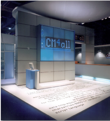
Content Management AG Stand auf der Internet World, Berlin