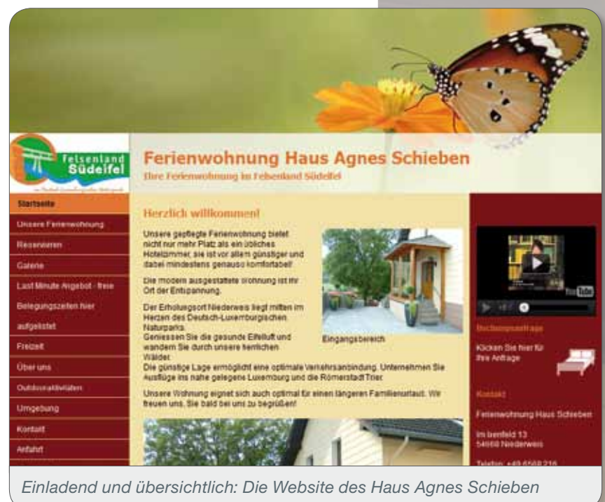
Einladend und übersichtlich: Die Website des Haus Agnes Schieben