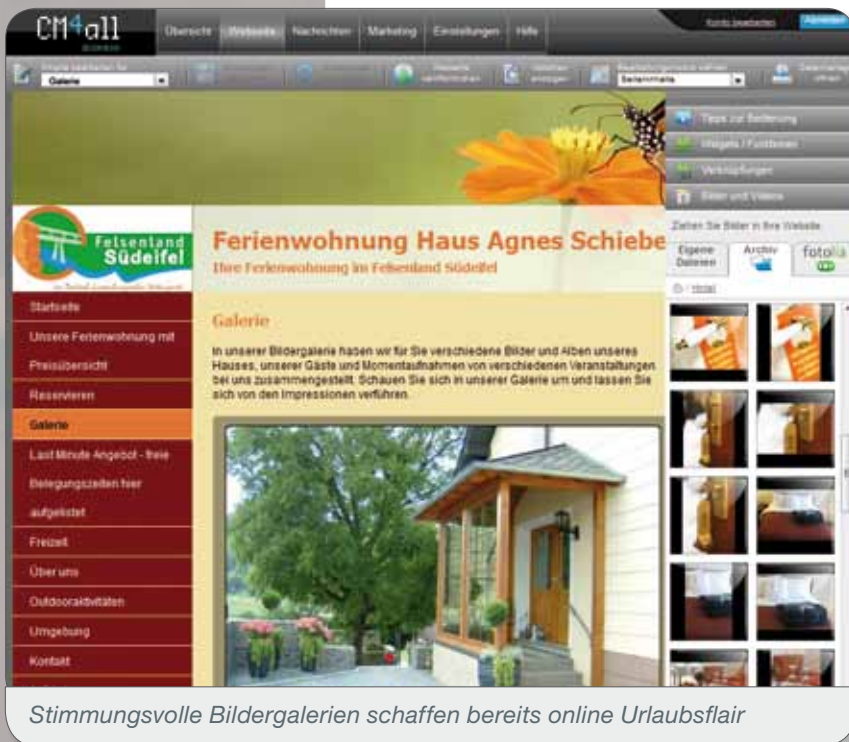
Stimmungsvolle Bildergalerien schaffen bereits online Urlaubsflair

„Ich möchte meinen Gästen aktuelle Informationen bieten und dabei nicht von Dritten abhängig sein. CM4all Business bietet mir diese Flexibilität.“